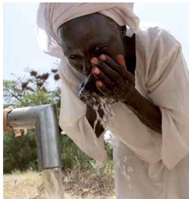
Til venstre: Kirkens Nødhjelp samarbeider med partneren CHAM om å dele ut mat på en skole i Malawi. Til høyre: En av seks mennesker i verden har ikke tilgang til rent drikkevann. Tilgang til rent vann er en forutsetning for god helse, og derfor grunnleggende i alt utviklingsarbeid. Her fra en vannpumpe Kirkens Nødhjelp har installert i Sudan.